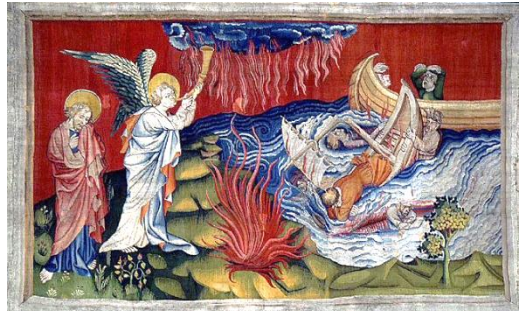
La Tapisserie de l'Apocalypse

Offertoire : Seigneur dirige et sanctifie